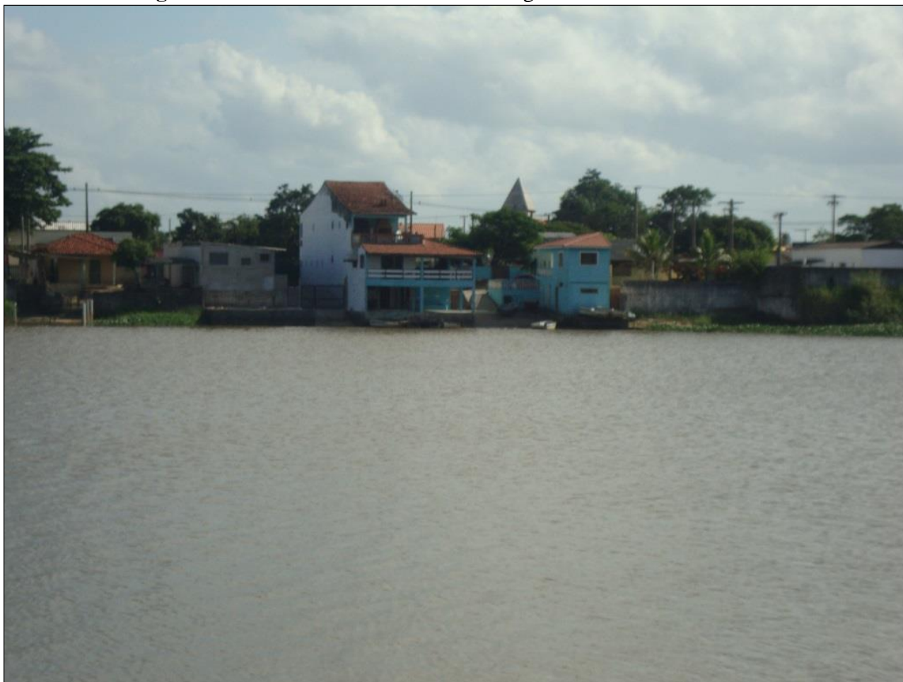
Figura 5 – Residências localizadas na margem direita do Valo Grande

largura suficiente para comportar grande volume de água. A erosão ocorrida no canal “engoliu” parte da cidade. Ainda hoje, parte da população vive próximo às margens do canal, como mostra a Figura 5.