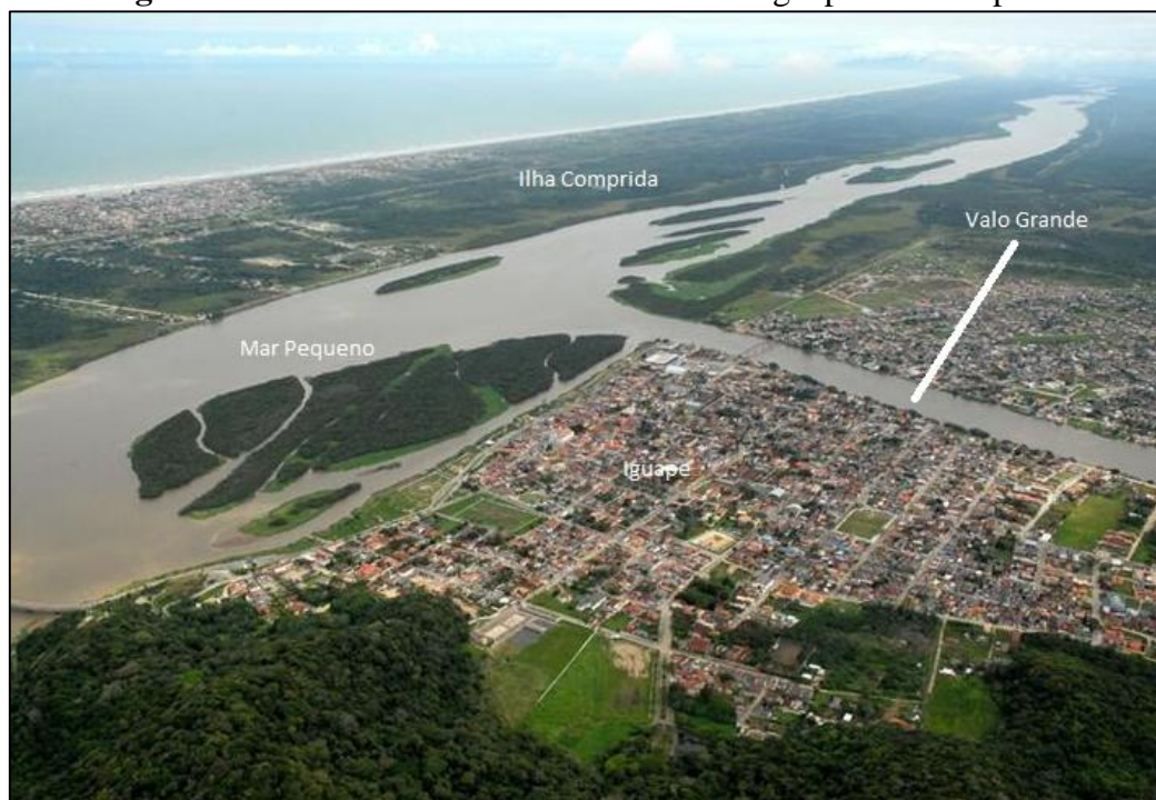
Figura 3 – O Valo Grande divide a cidade de Iguape em duas partes