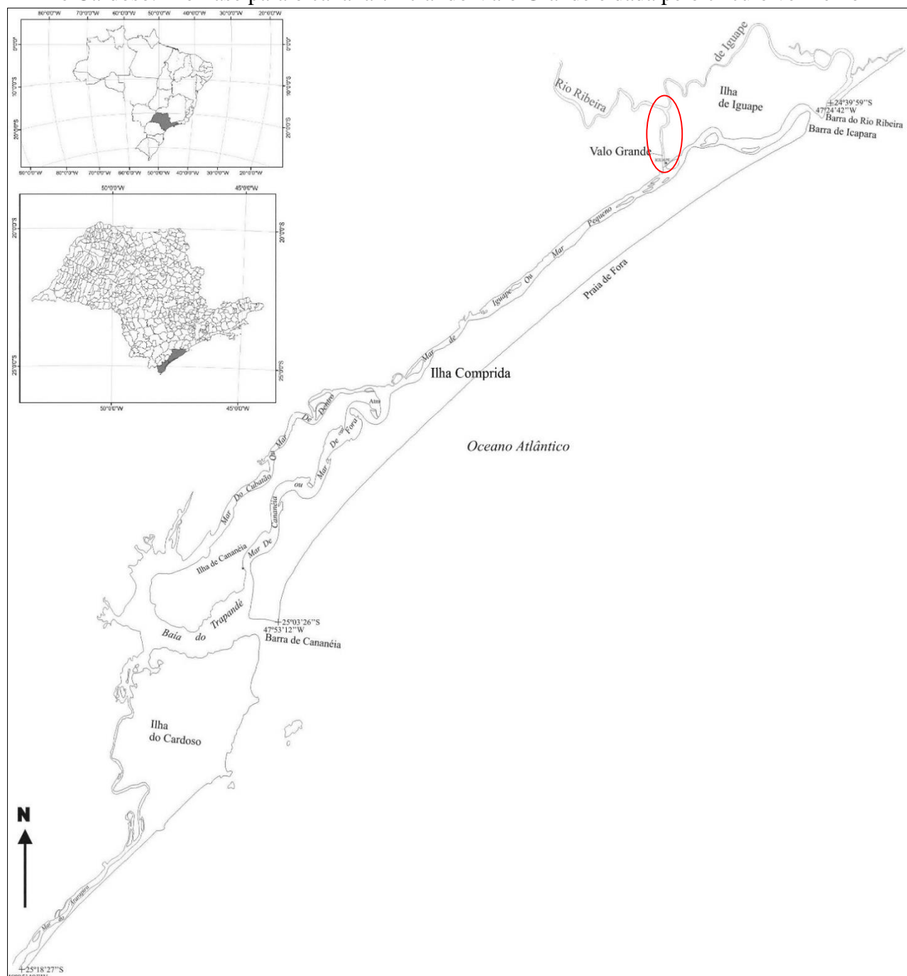
Figura 1 – Localização da área de estudo, com a presença das ilhas de Iguape, Comprida, Cananeia e Cardoso. A ênfase para o canal artificial do Valo Grande é dada pelo círculo vermelho